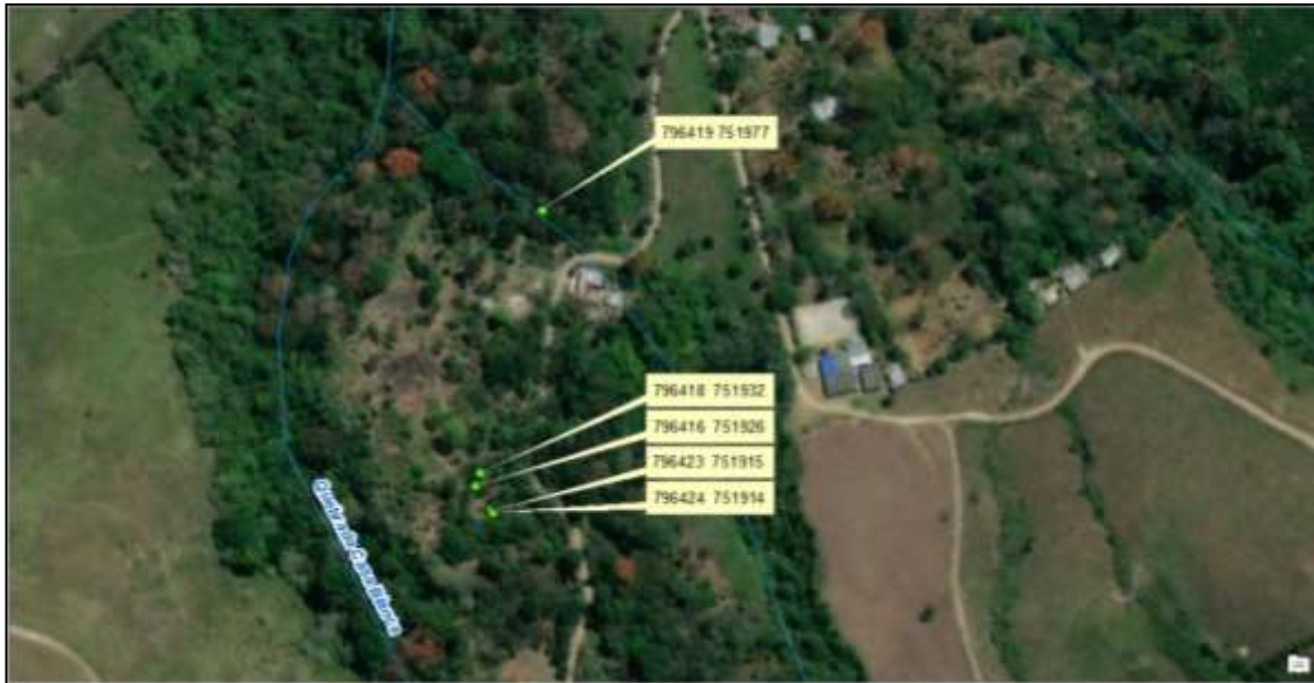
Imagen 1. Localización del punto objeto de la visita. Coordenadas tomadas con el GPS GARMIN MONTANA 680.

El lugar objeto de la visita no se encuentra inmerso dentro de ninguna figura de conservación al verificarse en el SIG de la CAM mediante vistas aéreas. Sin embargo, se encuentra localizado sobre la ronda hídrica de un drenaje sencillo afluente de la quebrada Casa blanca.