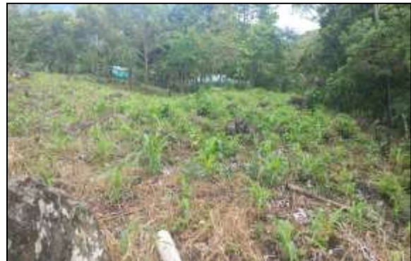
Imagen 6 y 7. Predio objeto de la visita. Imágenes tomadas con el Samsung Galaxy A32.