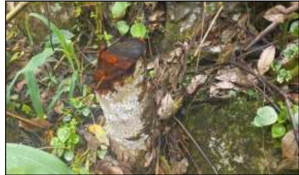
Imagen 3 a 6. Árboles intervenidos. Imágenes tomadas con el Samsung Galaxy A32.