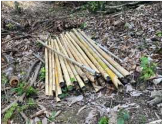
Figuras 13, 14, 15, 16, 17 y 18: Material apilado en el lugar.