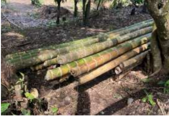
Figuras 11 y 12: Material apilado en el lugar.