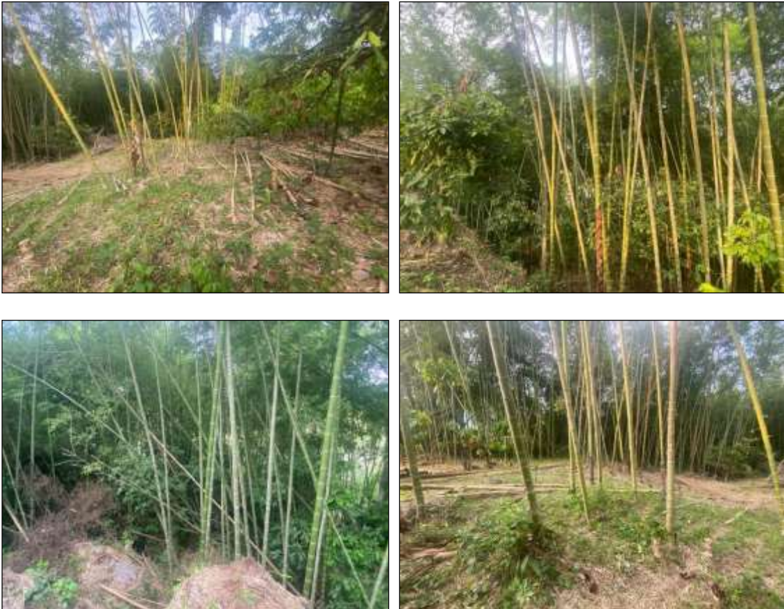
Figuras 1, 2, 3 y 4: Estado del guadua debido a las malas técnicas implementadas en el corte.

Nota: Evidencias registradas con celular iPhone 11.