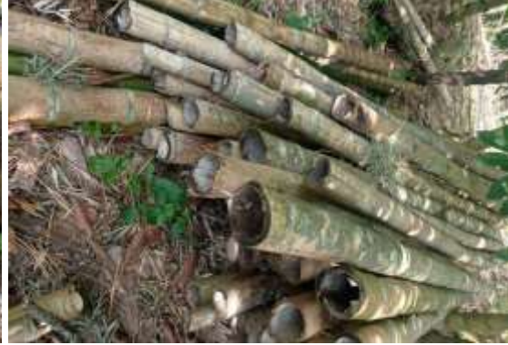
Nota: Evidencias registradas con celular iPhone 11.