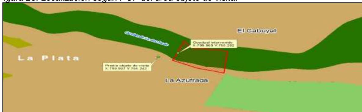
Figura 20: Localización según POF del área objeto de visita.